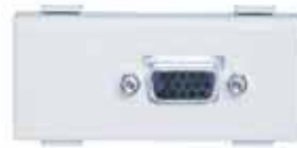
HD-15pinタイプ (音声なし) AT-D15 定価：オープン