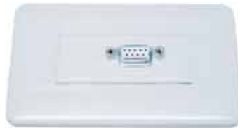
モダンプレート装着例