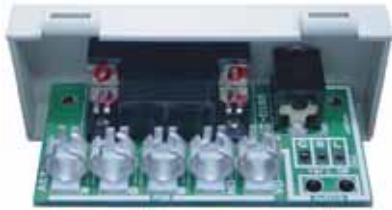
写真はV5-3C用 V5-1.5C用もございます