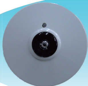
赤外線受光ユニット