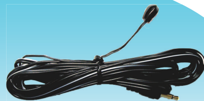
赤外線発光ユニット