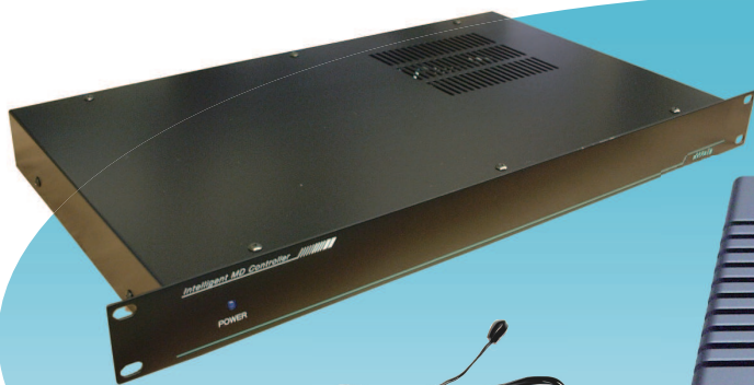
子機1台につきIRケーブル2本付属